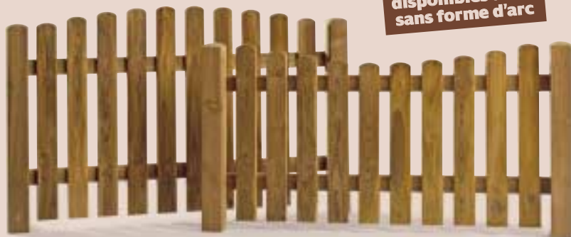
Clôture à frises

Clôtures disponibles aussi sans forme d'arc