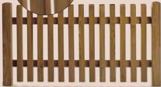
Clôture en lattis

disponible en bois de douglas imprégné en autoclave, profil de clôture 4 x 6 cm